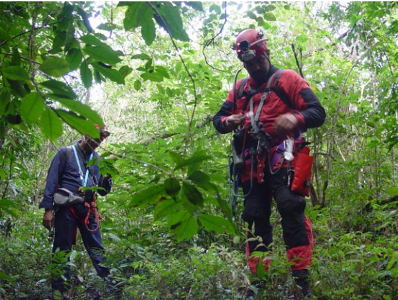
Aproximación al Sistema de Tepepulco