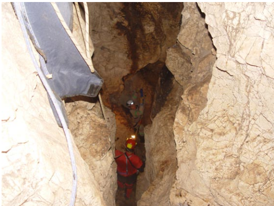
Armando la Ruta, Foto; P. León (MyC)

también amplio, que tiene al final una grieta con el tiro de 3m que lleva a otro de 11m. Se recorren como 8m de galería hasta llegar a una grieta estrecha, desde la que se puede alumbrar un cuerpo de agua, y que en una de sus partes permite el "paso de los flacos" para avanzar los 3m del último tiro donde se ha llegado. Quien logra pasar esta estrechez sobre paredes cubiertas de lodo se puede dar cuenta que el cuerpo de agua que se alumbraba desde arriba no es más que un pequeño charco. Se puede avanzar unos 8m más en esta parte estrecha, y hasta donde se puede alumbrar, la caverna sigue descendiendo en forma progresiva en la misma dirección, pero el siguiente paso es más estrecho y requiere verdaderas capacidades de contorsionista. (Benjamín Cruz)